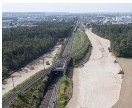
Erdarbeiten zur Herstellung der neuen Bahntrasse im Bereich der Überwerfung

28. Oktober bis 8. November 2022: Oberleitungsarbeiten / lärmintensive Rammarbeiten