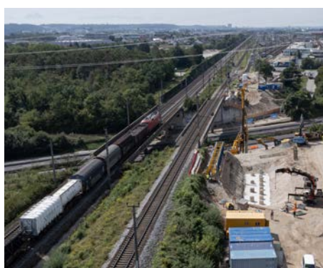
Die Errichtung der neuen Brücke über die A25 läuft auf Hochtouren