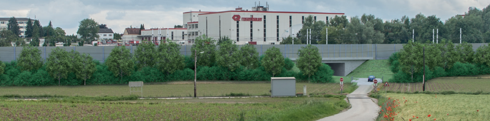
Die Unterführung Hofackerstraße wird verbreitert.