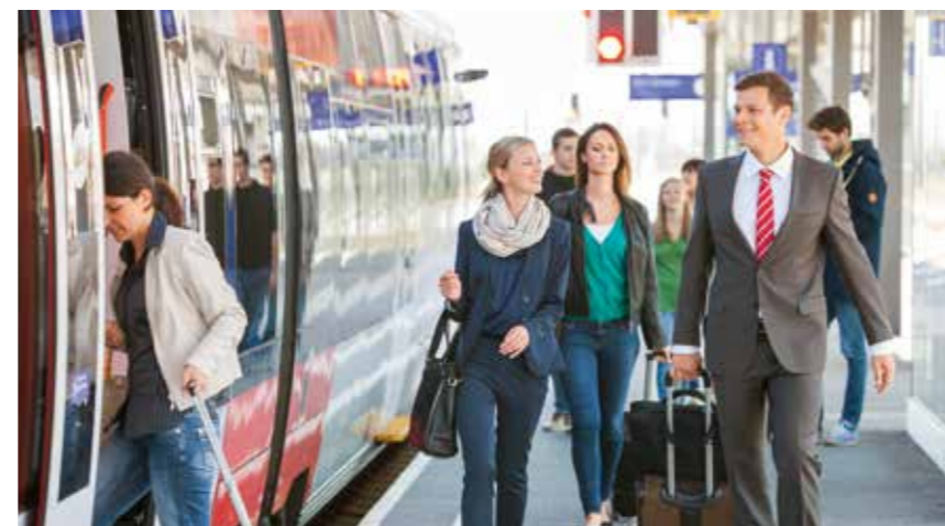
Umweltfreundliche Mobilität für die Zukunft.

Für Fahrgäste, die in Neufeld aus- bzw. einsteigen, entfällt die fünf- bis sechsmünütige Stehzeit im Bahnhof Ebenfurth. Die Züge aus dem Burgenland fahren künftig von Neufeld direkt weiter nach