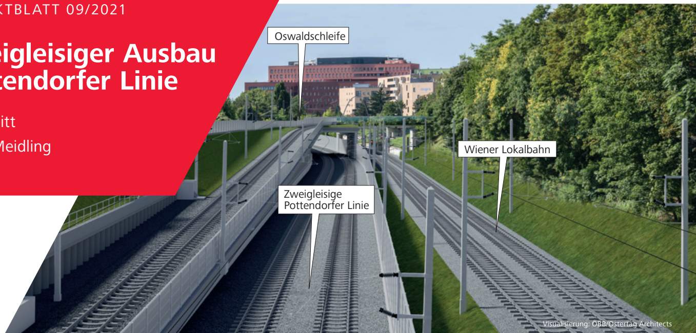
Streckenbild auf Höhe Wittmayerbrücke