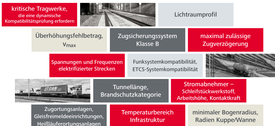
Beispiele Monitoring relevanter Infrastrukturdaten (IDM)